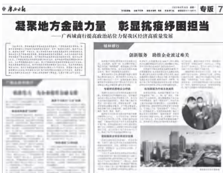
广西日报报道版面。

值得关注的是，桂林银行聚焦个体工商户资金需求“短、小、频、急”特征，不断深化产品创新供给，高效便捷满足个体工商户的用款需求。强化“税银合作”，针对个体工商户担保能力较弱的特点，以科技赋能，运用税局提