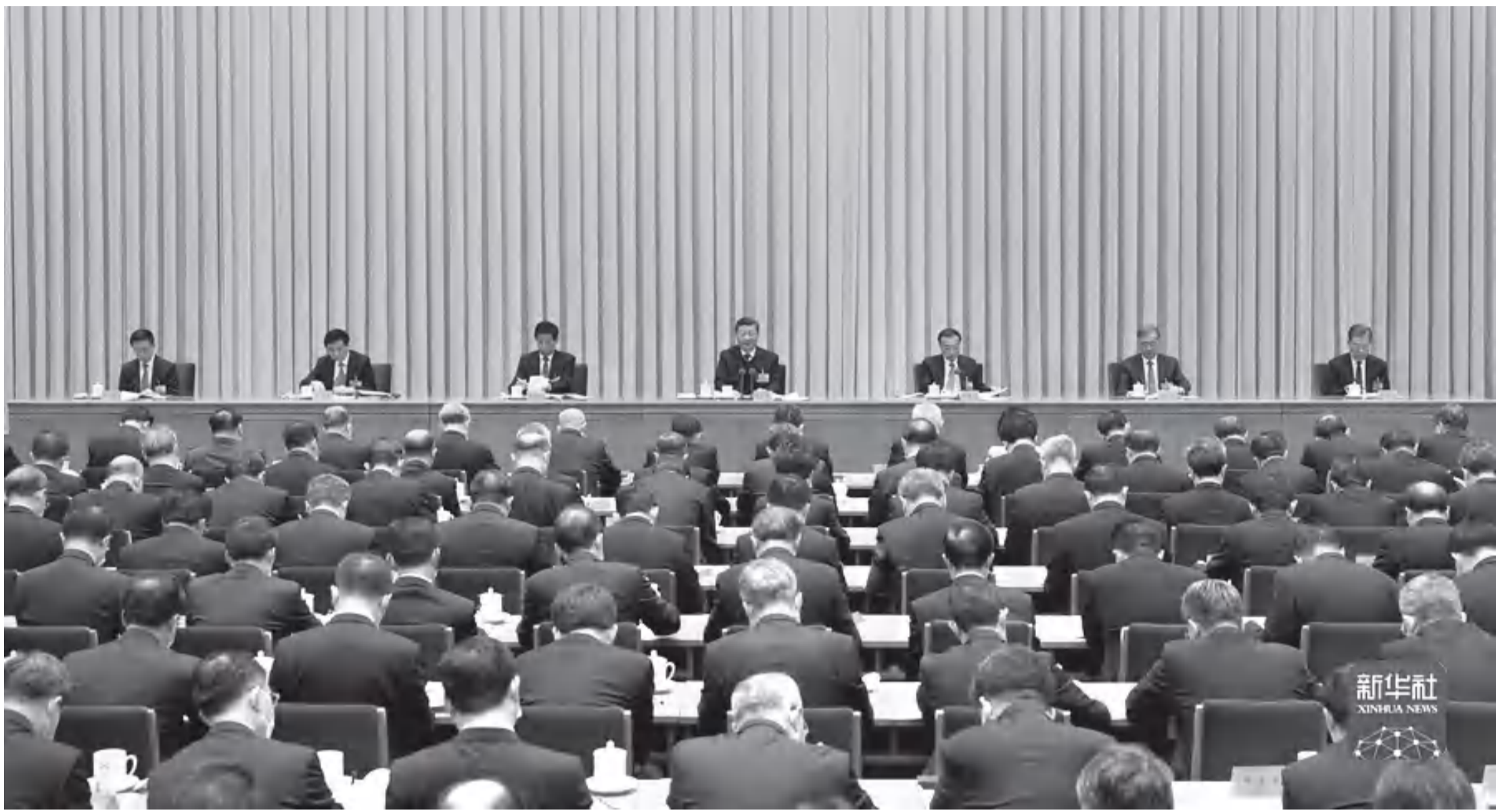
新华社 XINHUA NEWS

新华社北京12月10日电 中央经济工作会议12月8日至10日在北京举行。中共中央总书记、国家主席、中央军委主席习近平，中共中央政治局常委李克强、栗战书、汪洋、王沪宁、赵乐际、韩正出席会议。