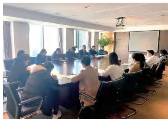
12月2日,在会议室进行萧山区、所前镇人大代表候选人民主测评工作。