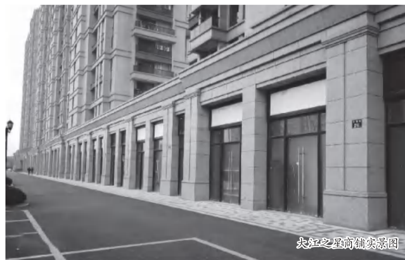
大江之星商铺实景图