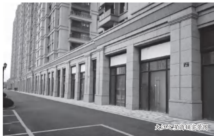
大江之星商铺实景图