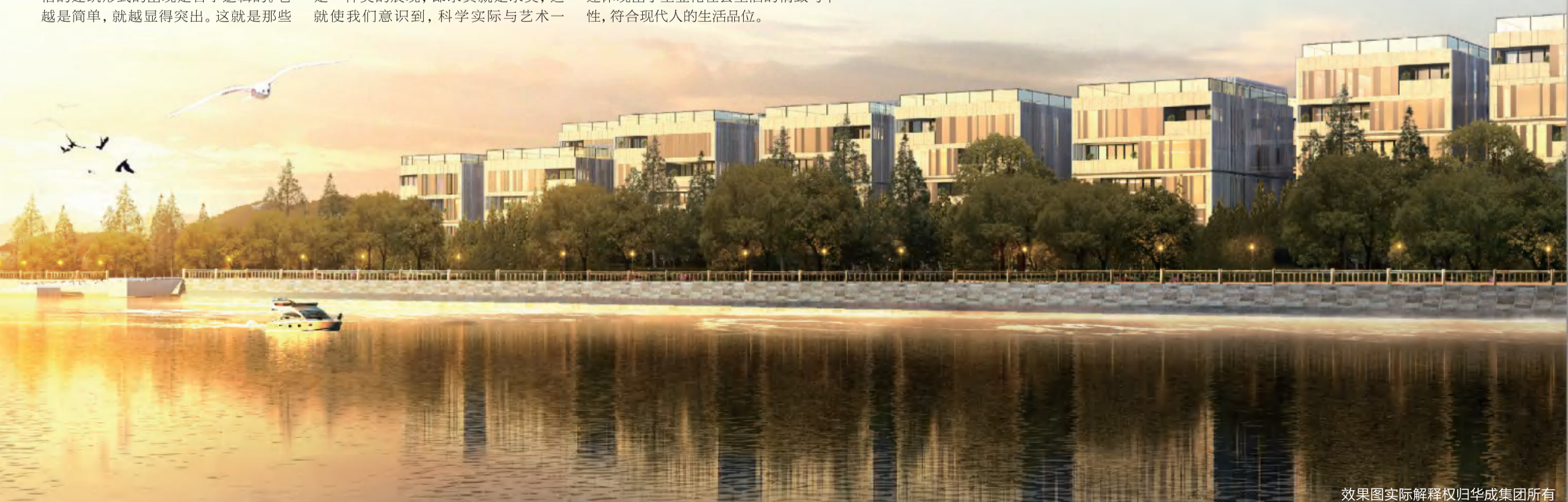
效果图实际解释权归华成集团所有