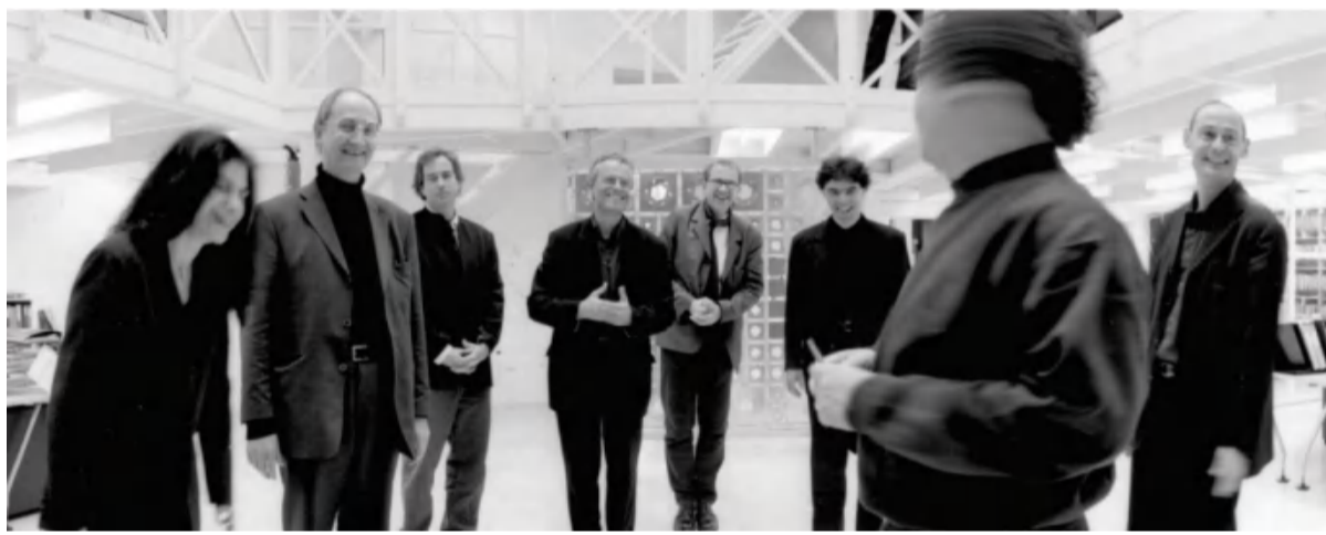
白塔项目设计团队——法国AS建筑设计工作室