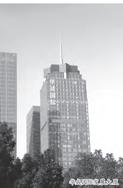
华成国际发展大厦