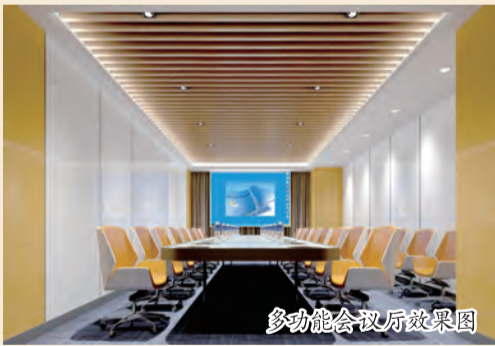
多功能会议厅效果图