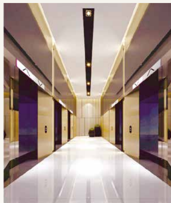
办公室电梯张间效果图