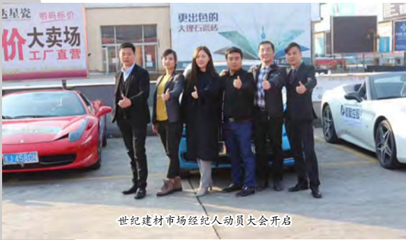
世纪建材市场经纪人动员大会启动

【编者按】回眸2017年，是华成集团稳中求进、锐意进取、持续发展的一年。在集团公司管委会的正确指引和英明决策下，在公司上下全体同事携手同心、共同努力下，我们“着重战略调整、深入资本运营、加强团队建设、增进营销意识”在2017年底交上了满意的答卷。