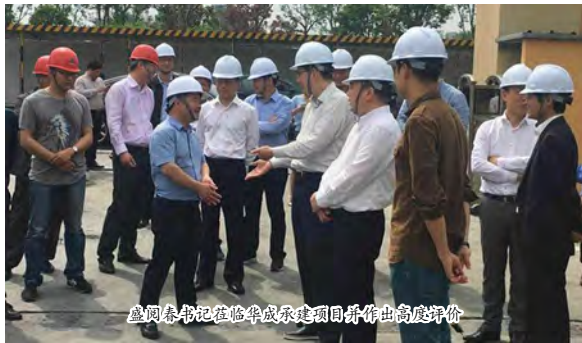
盛网春书记在临华成承建项目作出高度评价

▲2017年12月29日起，华成·大江之星小区全部675户新房正式拉开了交房序幕，幸福如约而至。