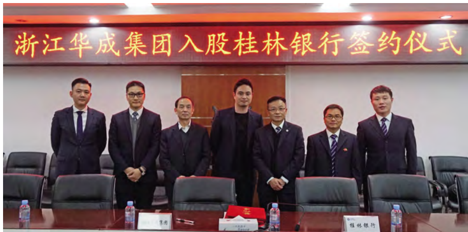
浙江华成集团入股桂林银行签约仪式