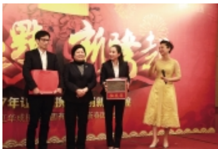
二等奖:真丝睡衣礼盒