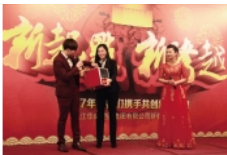
三等奖:纪念币礼盒