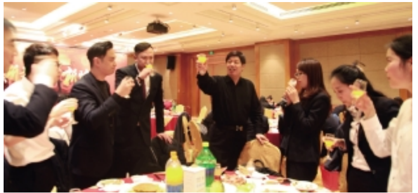
沈董与员工举杯共庆新年