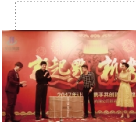
特等奖:乐视彩电一台