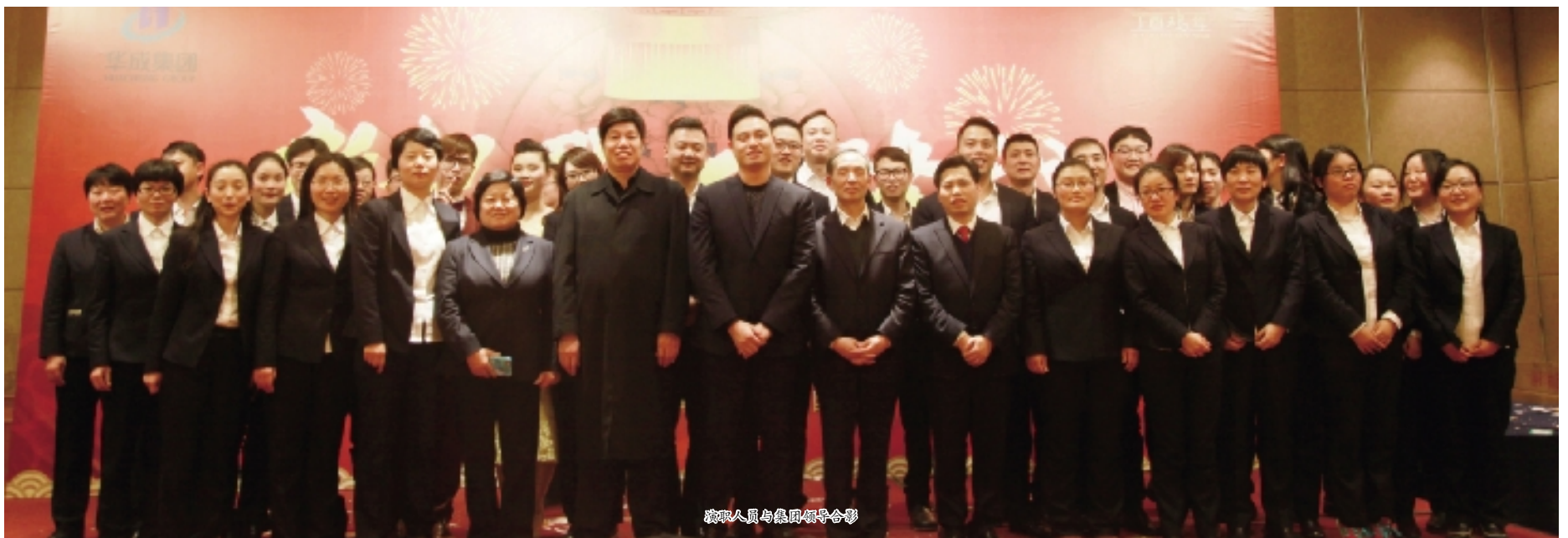
管理人员与集团领导合影