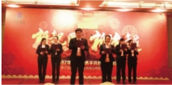
天地盟国节目:诗朗诵《希望与梦想》