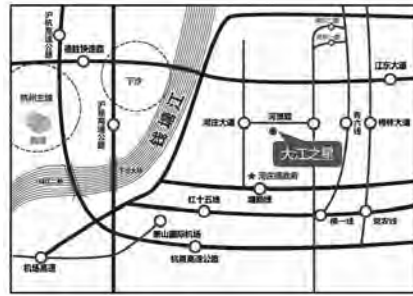
【大江东起】炙手可热的新兴板块

滨江华成·钱塘艺墅项目原为复兴白塔 u11-3-1 地块,看到这里,很多了解杭州高端房地产的人马上会眼前一亮,这绝对是最纯正的豪宅血脉源流啊。项目与之路、复兴路相连,背靠玉皇山,南临钱塘江和中河源头,西接白塔公园,与六和塔、西湖风景区也近在咫尺。可以说放眼杭州也再难找这样集风景、地段于一体,大隐于市的好地方了。项目建筑用地 13375 平方米,总建筑面积 27338 平方米,容积率 1.48。