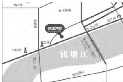
【天生贵胄】放眼杭城再难找的好宅地

滨江华成·钱塘艺墅项目原为复兴白塔 u11-3-1 地块,看到这里,很多了解杭州高端房地产的人马上会眼前一亮,这绝对是最纯正的豪宅血脉源流啊。项目与之路、复兴路相连,背靠玉皇山,南临钱塘江和中河源头,西接白塔公园,与六和塔、西湖风景区也近在咫尺。可以说放眼杭州也再难找这样集风景、地段于一体,大隐于市的好地方了。项目建筑用地 13375 平方米,总建筑面积 27338 平方米,容积率 1.48。